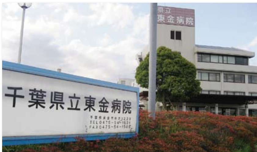
総合医・家庭医の育成に取り組む千葉県立東金病院

千葉県ではまず01年に県内8病院が連携し、病院群で研修医を受け入れるプロジェクトをスタート。04年から08年までに54人の初期研修医を受け入れてきた。次いで06年には後期研修医を受け入れる「千葉県立病院群レジデント制度」を導入。このレジデント制度では専門医取得までの期間は病院局職員としての身分を保障した。さらに東金病院では日本内科学会の認定医・専門医、日本内分泌学会の専門医資格などを取得できるようにし、医師にとって魅力のある環境作りに取り組んできた。このような取り組みにより、東金病院の内科医は06年上期の2人から10年前